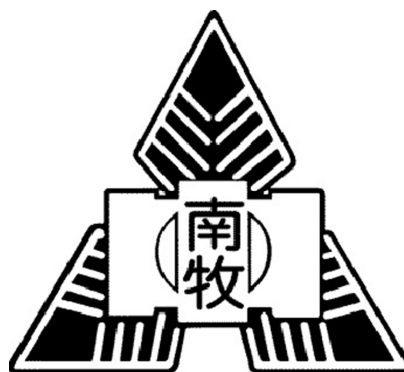
南牧中学校 校章（S63 制定）