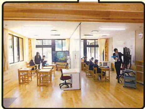
壁のないオープンスペース型の学習空間 少人数の利点とICTを駆使した授業