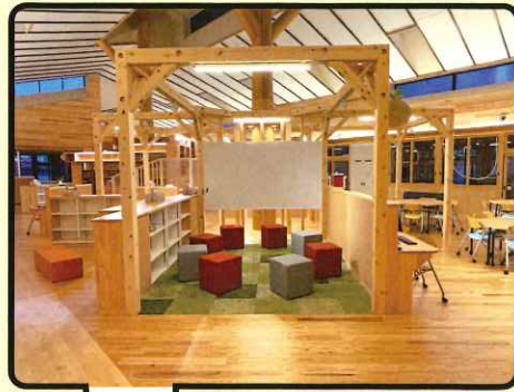
南牧産の木材を利用した快適な創造空間