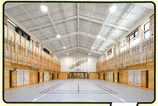
避難所機能を併せ持つアリーナ