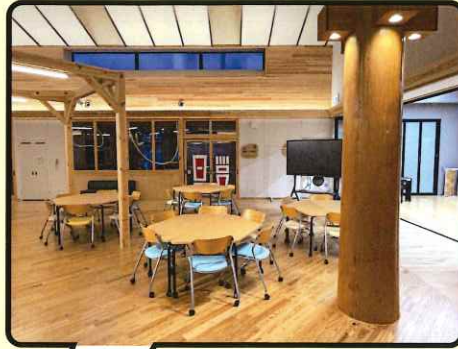
一日の始まりを全員で迎えるホームベース