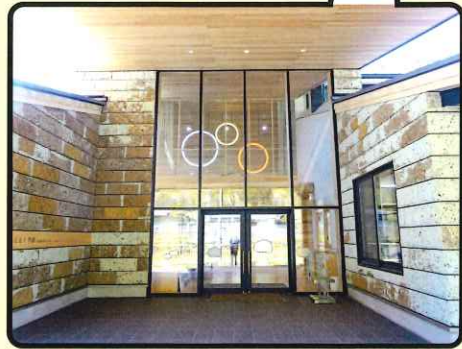
南牧村の伝統行事「火とぼし」をイメージしたライトが出迎える児童生徒玄関