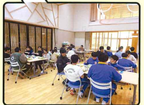
児童生徒教職員みんなで給食を食べるランチャールーム 多目的ホールとして様々な活動で利用