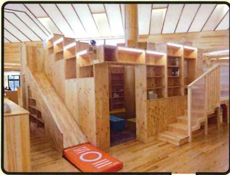
体を動かして思考を促す様々な設備